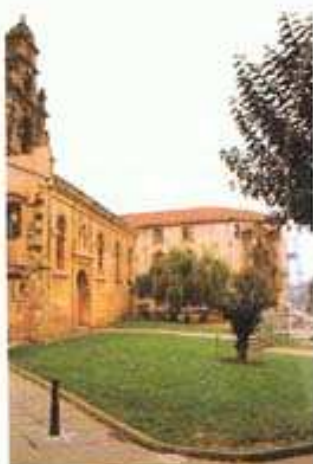
Convento - Casa Cultura