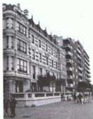
Borda de Ria