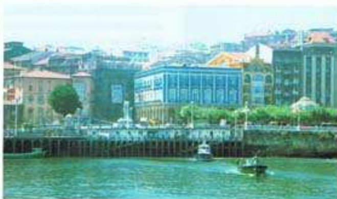
Ayuntamiento - Ria

Amaitzeko, espezialistek esan behar diegu Portugaleteko hilerrian (Bilboranzko irteeran, autobidetik joanda) dozena erdi panteoi dagoela. Haietako batzuk ikusgarriak edo erabat erronan-rikoak dira. Hilerriak, gainera, oro zahaldura teorizatzailea dauka. Alberto Lopez arkitektoak egina.